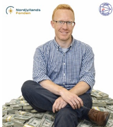
Sune sidder behageligt!

Følg også med i Farum Sejlklub Ungdom på Facebook.