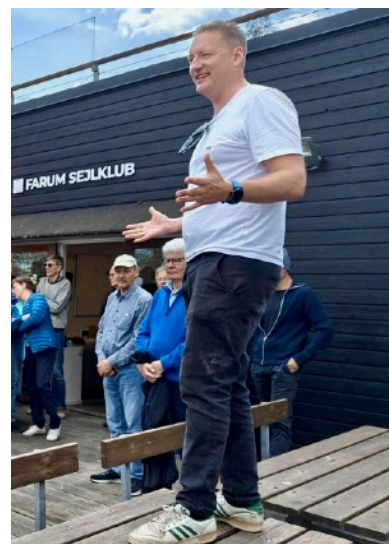
Formanden i sit Es

Herudover vil bestyrelsen, KU og jeg forsøge, at få skabt flere fællesskabs-skabende events, som tilsammen kan underbygge strategien.