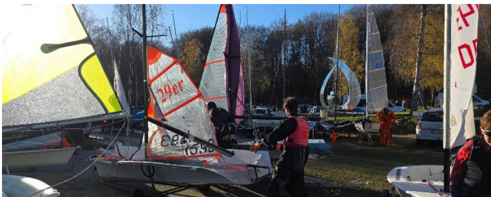
Ungdomsafdelingens vinteraktiviteter før sne og is lukkede søen!

Klik her og se ordensregler der skal følges, når der arbejdes i hallen.