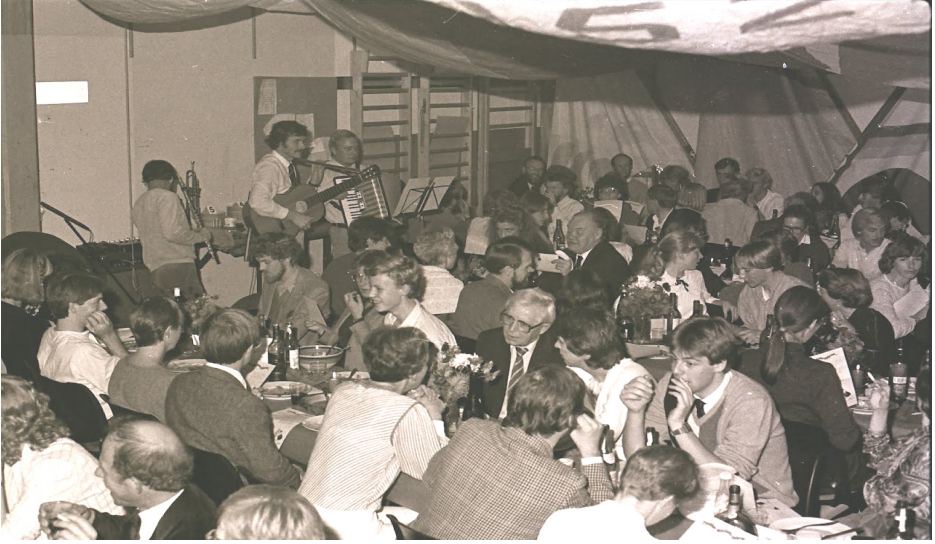
Fest i FAS 1984