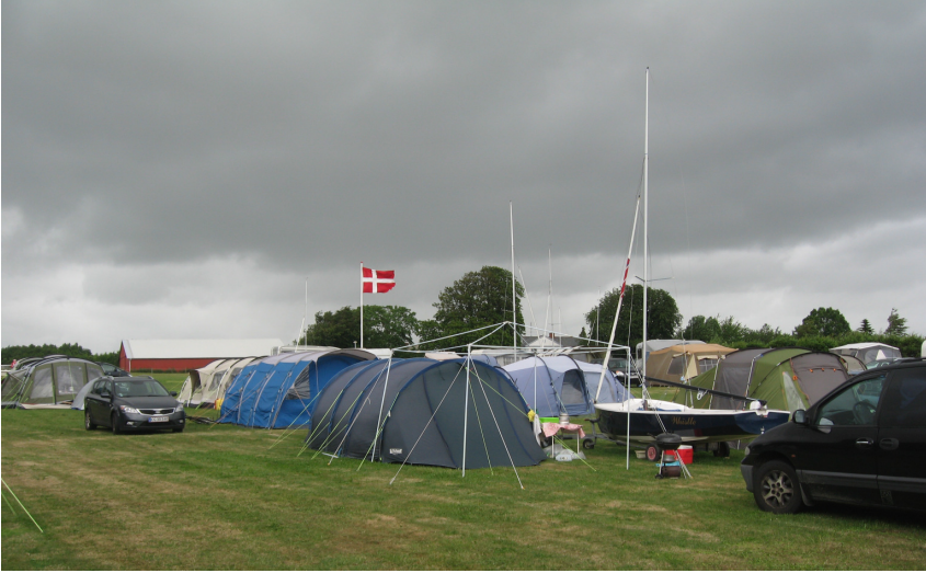
Fredag hvor Dannebrog smælder i den kraftige vind over campingpladsen.

Lørdag er det igen dejligt sejlvejr med jævn vind fra vest. Det er let overskyet, og vi trænger til at se solen, men det bliver kun i korte perioder. Vi glæder os over, at det ikke længere er kuling.