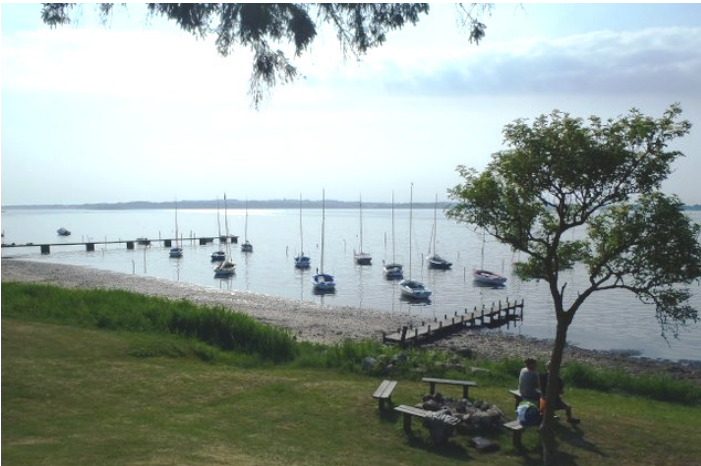
Joller ved Rantzausminde camping lørdag morgen

Søndag, hvor Rantzausminde træffet startede, var det nærmest vindstille.