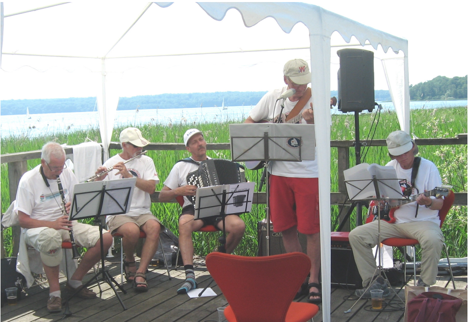
Farum Sejlklubs orkester underholder med sange, jazz og folkemusik.