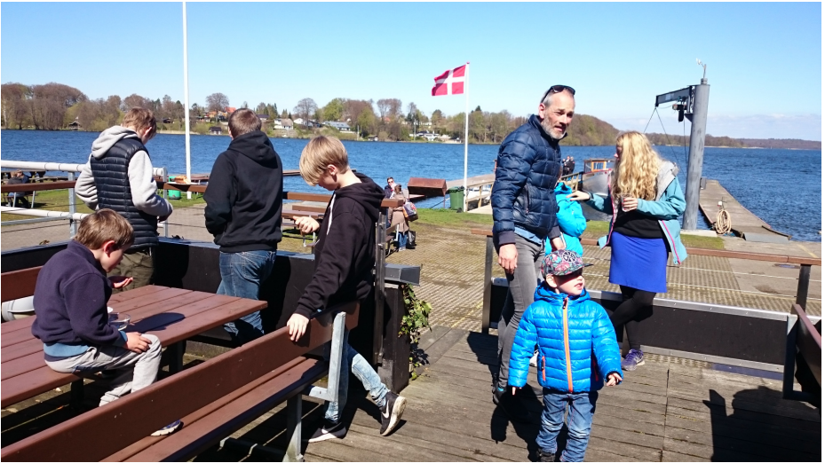
Fremtidens ungdomssejlere (Sanne P)