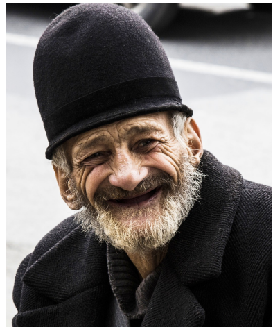
Wayfarersejlere bliver også Ældre!