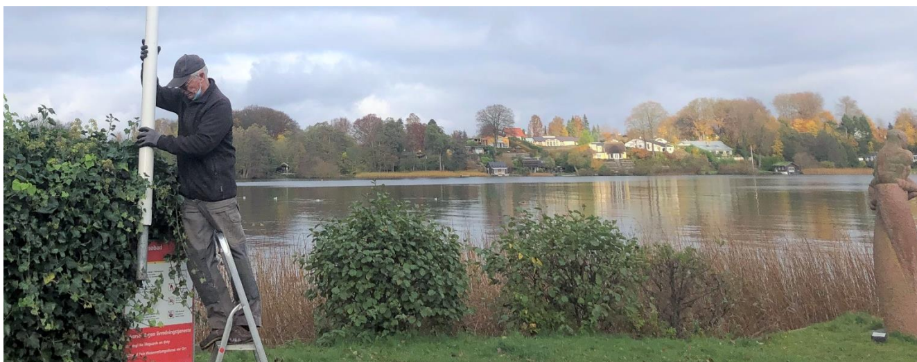
Næstformand Per Duelund stryger standeren.