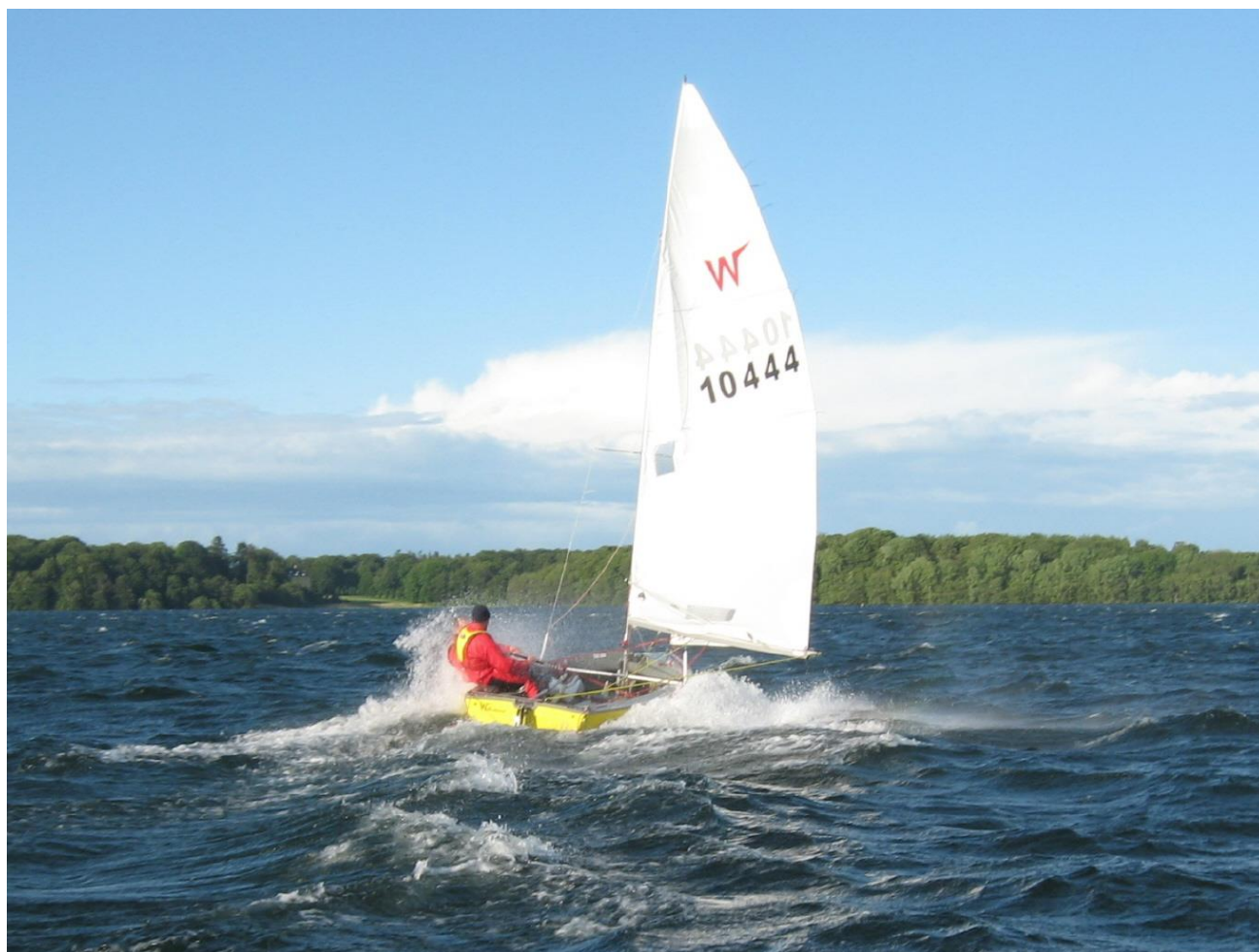
W10444 i kuling på Furesøen.