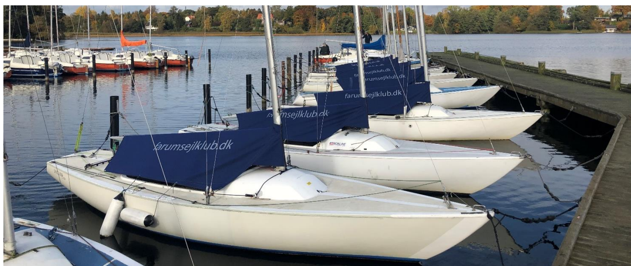
FAS-Ynglinge skarpt linet op i havnen.

De dygtige sejlere er begyndt at tage til stævner igen med gode resultater, og tre af dem skal til kapsejlads i Thurø Sejlklub på Fyn i den kommende weekend.