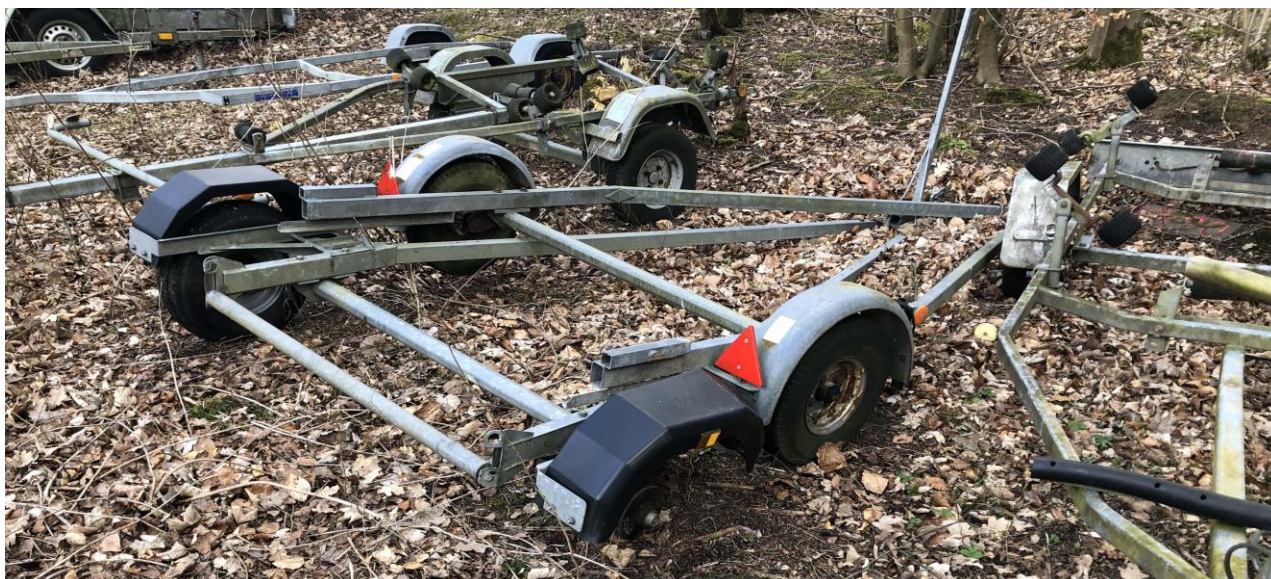
Foto optaget 3. april 2021 af en herreløs combitrailer til en Wayfarerjolle. Den mangler et hjul. Ejeren bedes venligst få traileren registreret hos pladsmanden og hjulet bragt i orden, så det er muligt at flytte traileren, hvis der skulle blive behov for det ved oprydning på jollepladsen 1. maj.

Vi har konstateret, at der er en del landevejstrailere på Farum Sejlklubs jolleplads, hvor vi ikke kan identificere ejeren.